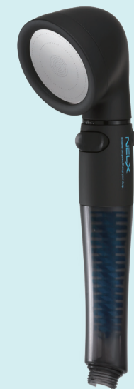
シャワーヘッド本体 Color 2色 (Black, Silver)