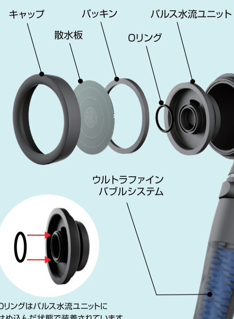
ウルトラファインパルスシステム