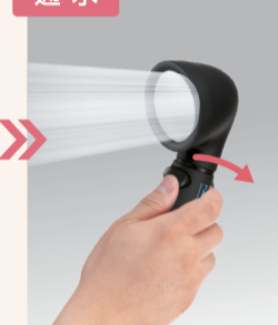
ボタンを右に押し て通水します。