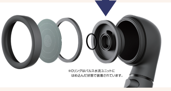
※Oリングはバルス水流ユニットにはめ込んだ状態で装着されています。