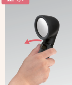
ボタンを左に押し て止めます。